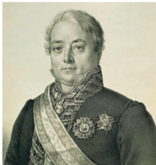
Tras la reforma administrativa llevada a cabo por Francisco Javier de Burgos, desapareció el Reino de Murcia formado por las provincias de Murcia y Albacete.

Sin embargo, a pesar de contar con el abundante arsenal del puerto, el cantón cartaginés solo pudo resistir hasta comienzos de 1874.